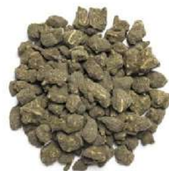
ЖЕНЬШЕНЬ УЛУН - GINSENG OOLONG -

Вкусовой союз чая, корня женьшеня и солодки. Насыщенный, молодой, заряжающий позитивом аромат. Тонизирует, повышает работоспособность.