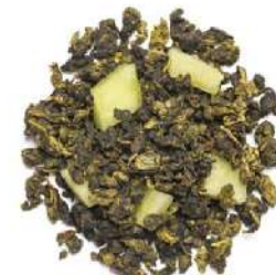
МЕДОВАЯ ДЫНЯ - HONEYDEW MELON -

Классический светлый улун, смешанный с кусочками спелой дыни. Аромат наполнен тонкой, деликатной сладостью сочного фрукта и мощной нотой свежего чайного листа. Мягко тонизирует, наполняет силами.