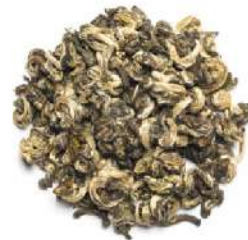
ИНЬ ЛО «СЕРЕБРЯНЫЕ СПИРАЛИ» - YIN LUO "SILVER SPIRALS" -

Терпкий, сладковатый с легкой горчинкой. Послевкусию длительной, с нотками меда и орехов. Нормализует работу поджелудочной железы и пищеварительной системы.