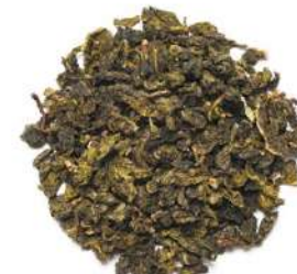
МОЛОЧНЫЙ УЛУН - MILK OOLONG -

Вкус легкий, лишь намекающий на молочные и карамельные нотки. Этот чай успокоит нервную систему и придаст бодрости.