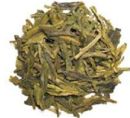
ЛУН ДЗИН «КОЛОДЕЦ ДРАКОНА» - LONGJING "DRAGON'S WELL" -

Яркий, долгоиграющий цветочный аромат. Обладает нежным травяным и чуть медовым послевкусием. Содержит витамин С, аминокислоты и катехины.