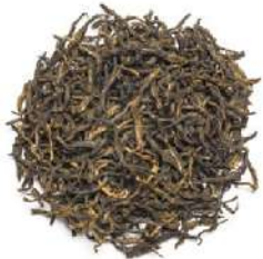
ДЯНЬ ХУН - DIAN HONG -

Немного фруктовый, обволакивающий, этот бодрящий и отлично согревающий чай мгновенно восстанавливает физические силы.