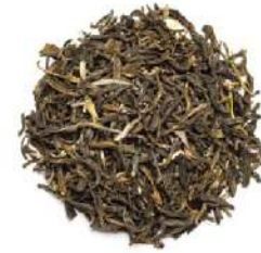
МОЛИ ХУА ЧА С ЦВЕТАМИ ЖАСМИНА - MOLI HUA CHA WITH JASMINE FLOWERS -

Отборный зеленый чай с цветками жасмина. Вкус легкий и нежный. Снимет усталость и напряжение.