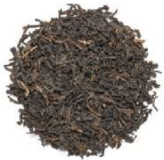
ЛИ ЧЖИ ХУН ЧА С СОКОМ ЛИЧИ - LEE CHZHI HONG CHA WITH LYCHEE -

Сочетает в себе мягкую душистость свежего красного чая с тропической сладостью натурального сока личи. Обладает легким тонизирующим действием.