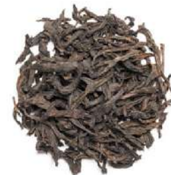
ДА ХУН ПАО «БОЛЬШОЙ КРАСНЫЙ ХАЛАТ» - DA HONG PAO "BIG RED ROBE" -

«Жемчужина всех чаев» в Китае. Вкус бархатный, сладкий, с легкой кислинкой, с ароматами сухофруктов и хлебными нотками. Активизирует мыслительные процессы.