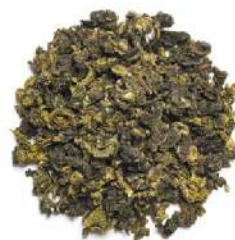
ТЕ ГУАН ИНЬ «ЖЕЛЕЗНАЯ БОДХИСАТТВА» - TIEGUANYIN "IRON GUANYIN" -

Легендарный чай. Входит в десятку значимых чаев Китая. Вкус богатый, слегка сладковатый, медовый, с ароматом сирени и дождя. Стимулирует умственную и физическую активность.